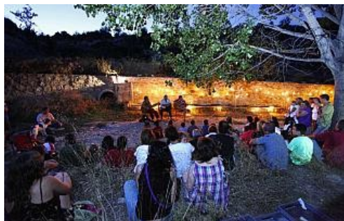
La "Font de les Pilettes" en el último acto celebrado este mes.

"Les Fonts de Xixona" es una agrupación creada hace unos meses que se encarga de localizar, documentar y publicar las diversas fuentes naturales existentes en el municipio. A pesar de estar en una zona de secano, la localidad presenta más de ochenta manantiales desde donde brotan tanto agua dulce como salada.