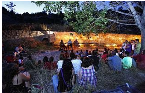
La "Font de les Pilettes" en el último acto celebrado este mes. información

"Les Fonts de Xixona" es una agrupación creada hace unos meses que se encarga de localizar, documentar y publicar las diversas fuentes naturales existentes en el municipio. A pesar de estar en una zona de secano, la localidad presenta más de ochenta manantiales desde donde brotan tanto agua dulce como salada.